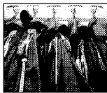
Sentenza in Appello

Piace il progetto Bonizzato. Il capogruppo del Pd bacchetta la giunta: faccia in fretta